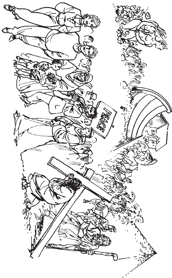
Der Ahnenzug, Künstler unbekannt